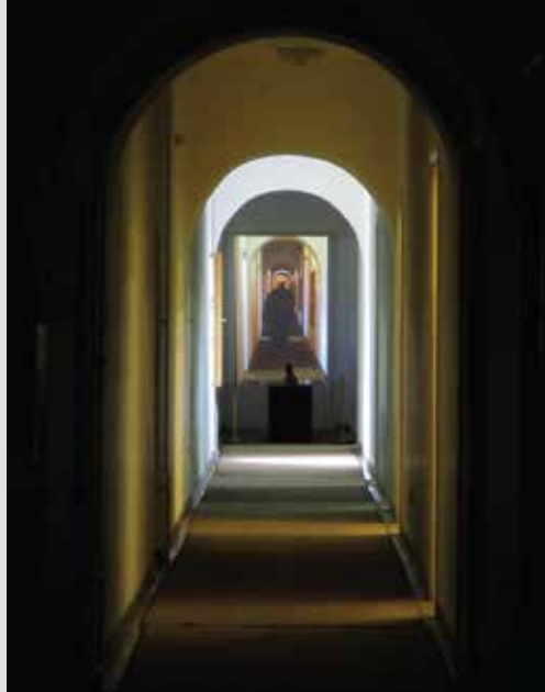
Salas IX, X, XI

Su plan era hacer la moneda y preparó para ello todas las herramientas necesarias, que luego se encontrarían en el monasterio de Cetinje; el borrador del papel moneda lo hizo solo. Se suponía que se llamaría Perun, por el dios del trueno eslavo. En esta sala se encuentra también una impresión de dinero en cera. También está la primera edición de Luz de Microcosmo, canto filosófico-religioso de Njegos. Para el surgimiento de esta obra maestra, no fue necesario ir a lugares oscuros y aislados donde, con el brillo de la gloria, transformaría su visión en versos inmortales. Había sido suficiente un paisaje, y el olor del ambiente místico de su construcción rocosa. Una relación inextricable abarca también el telescopio, obra de Plezl, producido en Austria en 1835. Las pinturas de las paredes de ésta y de las tres salas siguientes, son obra del pintor académico montenegrino Pero Poček (1878- 1963). El ciclo Gorski vijenac está compuesto de 38 pinturas, y sus títulos fueron puestos por el mismo autor.