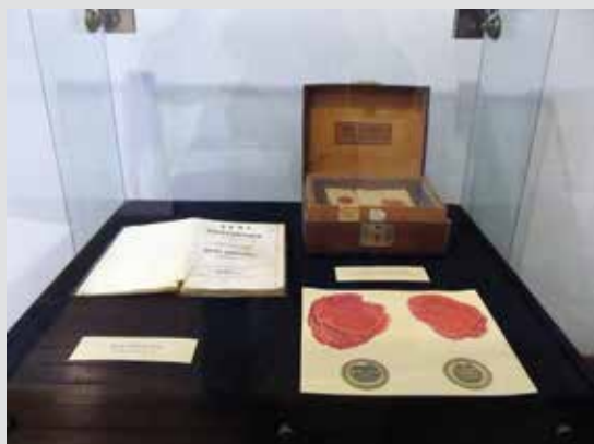
Sala VIII-Sala de la Moneda

Su plan era hacer la moneda y preparó para ello todas las herramientas necesarias, que luego se encontrarían en el monasterio de Cetinje; el borrador del papel moneda lo hizo solo. Se suponía que se llamaría Perun, por el dios del trueno eslavo. En esta sala se encuentra también una impresión de dinero en cera. También está la primera edición de Luz de Microcosmo, canto filosófico-religioso de Njegos. Para el surgimiento de esta obra maestra, no fue necesario ir a lugares oscuros y aislados donde, con el brillo de la gloria, transformaría su visión en versos inmortales. Había sido suficiente un paisaje, y el olor del ambiente místico de su construcción rocosa. Una relación inextricable abarca también el telescopio, obra de Plezl, producido en Austria en 1835. Las pinturas de las paredes de ésta y de las tres salas siguientes, son obra del pintor académico montenegrino Pero Poček (1878- 1963). El ciclo Gorski vijenac está compuesto de 38 pinturas, y sus títulos fueron puestos por el mismo autor.