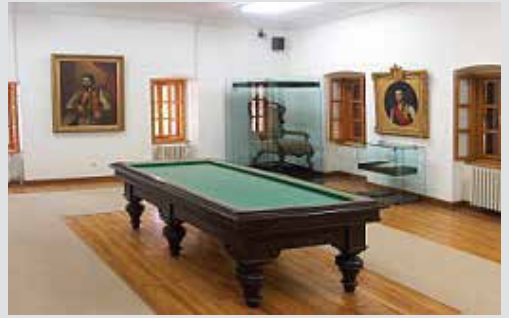
Sala II- Billar

El lugar central en esta sala lo ocupa una mesa de billar, que fue traída a Montenegro en 1840 desde Austria.