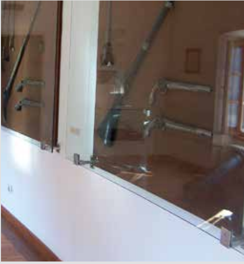
Sala I - Sala de Armas

Con motivo de la apertura del Museo Njegos en 1951, Josip Broz Tito donó una cantidad de armas de su colección.