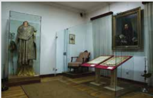
Sala IV - dormitorio

Como prueba de la extraordinaria habilidad militar del pueblo montenegrino, en esta sala se exhiben también armas como trofeos. Junto a ellas, también se exhibe el cinturón militar de Njegoš (silav), el modelo del primer buque de vapor que navegó el Adriático, un candelero y el sillón de Njegos. El sillón de Njegos guarda algo invisible, silencioso, intocable: en él le llevaron los montenegrinos, en manos, muy enfermo, de Kotor a Cetinje. Y en él pasó los últimos momentos de su vida... Un lugar importante en la exposición lo tiene el cuadro de una ceremonia sacra con un sabio, un regalo del emperador ruso durante el nombramiento de Njegoš como gobernante, en Rusia, en 1833. También están sus diplomas, los de alcalde (agosto de 1833), y de arzobispo metropolitano (1842), hechos de seda, plata y oro. El pintor esloveno Jozef Tominc, maestro de retratos y composiciones religiosas, representó a Njegos en su vestimenta de gobernador, durante su estancia en Trieste en 1837. Este es un trabajo reconocible de pintura portrética, que insiste en el componente psicológico, pero que también se centra en la decoratividad y la materialización.